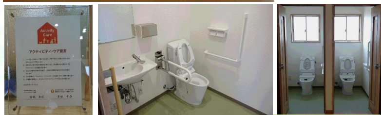
体調に合わせて選べるバス・トイレ

日々の生活を充実したものにするため、一人ひとりの生活文化にあわせてコーディネートさせていただきます。