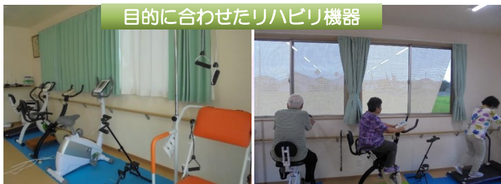
目的に合わせたリハビリ機器

脳や心身機能の維持・向上を図る援助活動であるアクティビティ・ケアは利用者様の生活をより豊かにするケアです。認知症予防または認知症高齢者の脳活性化、脳リハビリに活用され、効果を上げているものであります。当事業所においても生活に必要な身体機能の持続はもちろん、 認知症にならないため、認知症の進行を遅らせる ためにも、アクティビティ・ケアを通して精神の向上を目指しています。全国でも数少ない「心の栄養士」であるアクティビティディ