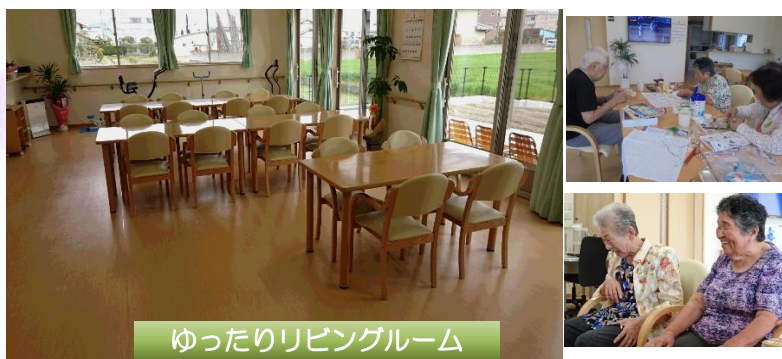
ゆったりリビングルーム